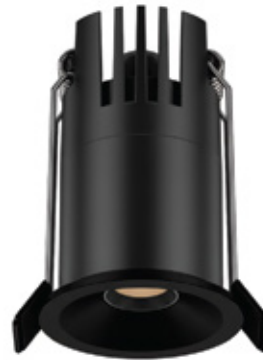
Acabado negro -03