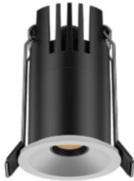
Acabado blanco -18