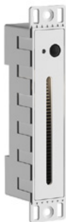
Acabado blanco -18