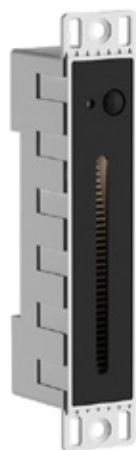
Acabado negro -18