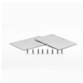
31-1212 Tapas laterales