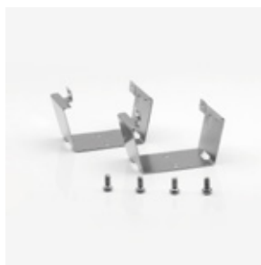
31-1218 Grapa sujeción disipador