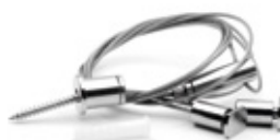
31-1214 Kit colgante