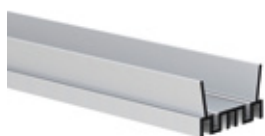
31-1217 Perfil disipador interno