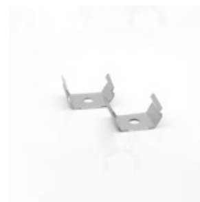
31-1213 Grapa sujeción